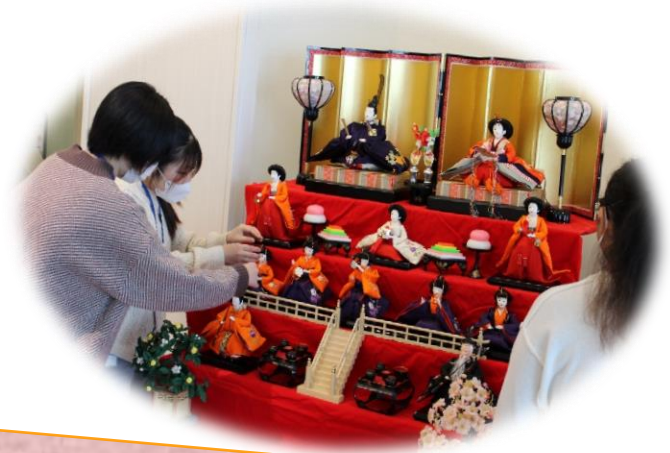
『雛人形』 1年生が飾ってくれました ✨